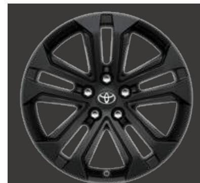
18" lichtmetalen velgen (5-dubbelspaaks)