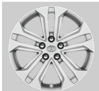
18" lichtmetalen velgen (5-dubbelspaaks)