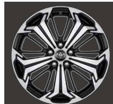
19" lichtmetalen velgen (5-spaaks)

Standaard op Dynamic Plus en Premium Plus