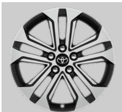
18" lichtmetalen velgen (5-dubbelspaaks)