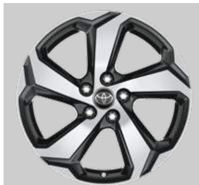
18" lichtmetalen velgen (5-spaaks)

Vervolledig uw look met een keuze uit opvallende 18" en 19" lichtmetalen velgen met gepolijste details. Binnenin de nieuwe RAV4 Plug-in, de hybride zwarte afwerkingsopties gaan van lederstijl tot echt leder met contrasterend rood stiksel, om een extra sportieve touch toe te voegen.